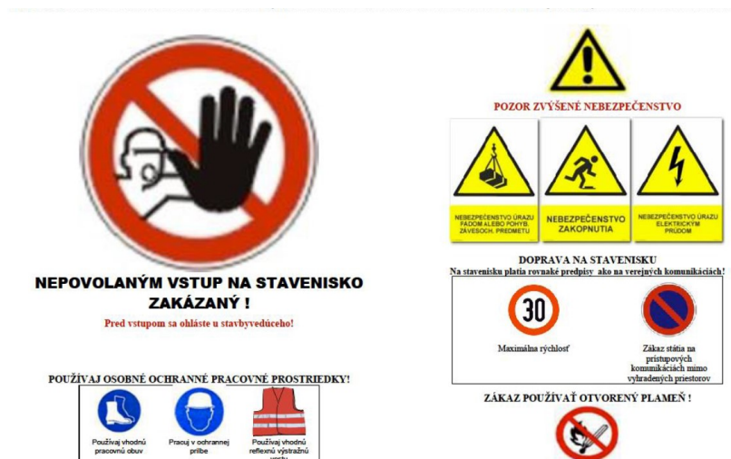
PRÍLOHA Č.3 : TABUĽA PRI VSTUPE NA STAVENISKO